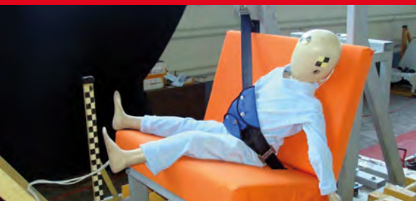
Результаты тестов использования небезопасных удерживающих устройств*

Дополнение определения «направляющая ляжка» в Правилах ЕЭК ООН № 44-04 было одобрено Всемирным Форумом (WP.29). Внесенная поправка к формулировке указывает на то, что «направляющая ляжка» рассматривается как составной элемент детской удерживающей системы и НЕ может отдельно официально утверждаться в качестве детской удерживающей системы в соответствии с настоящими Правилами». Это исключает даже формальную возможность сертификации устройств типа «направляющая ляжка»!